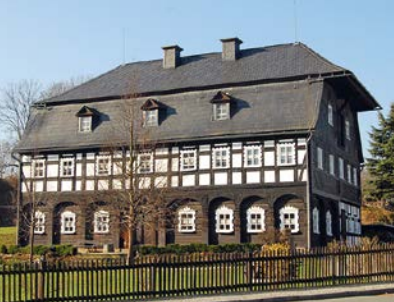
Ebersbach, Alte Mangel