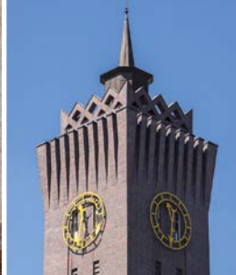
Chemnitz, ehemalige Maschinenfabrik Schubert & Salzer