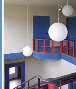
Niesky, Konrad- Wachsmann-Haus