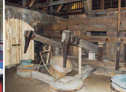
Olbernhau, Saigerhütte Grünthal, Hammerwerk